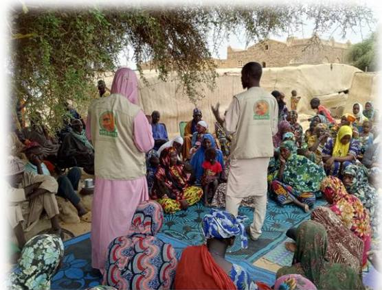
Séance de sensibilisation VGB - Niafunké - Juin 2025