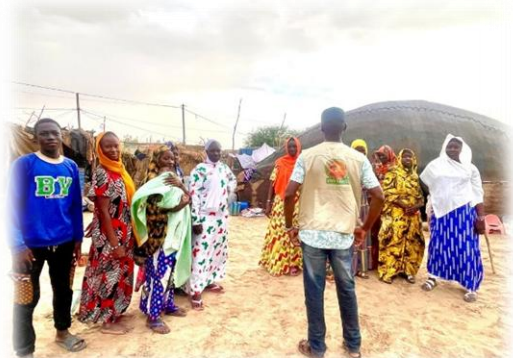
Séance de sensibilisation VGB - Tombouctou - Juin 2025