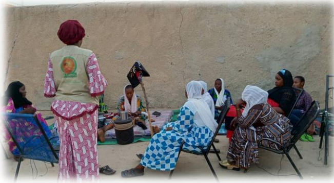
Séance de sensibilisation VGB - Goundam - Juin 2025