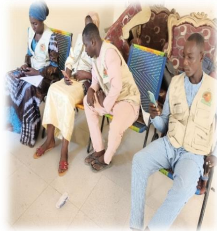
Formations des volontaires - Centre de Goundam - Mai 2025