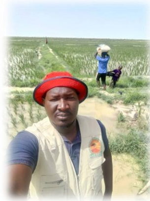
Suivi de la sécurité alimentaire et humanitaire - Tonka - Juin 2025