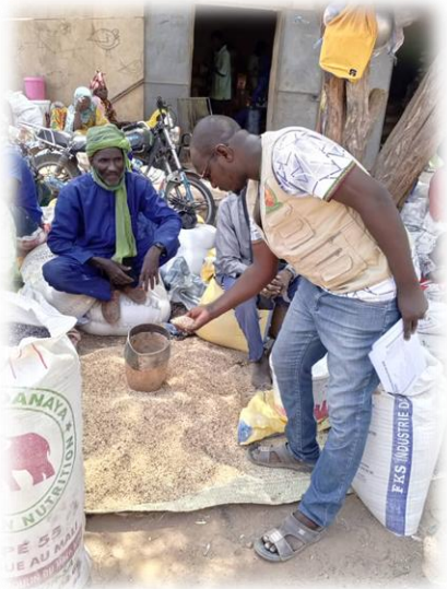
Suivi marché - Tonka - Juin 2025