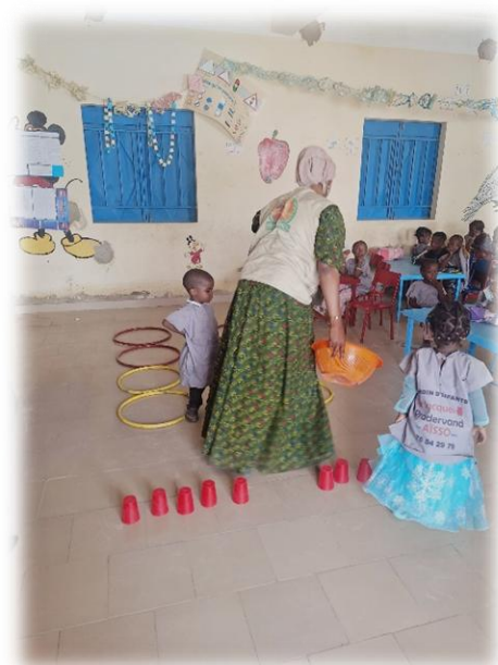
Séance de sensibilisation psychosociale - Tombouctou - Mai 2025