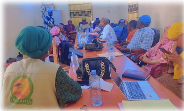
Formation sur la protection de l'enfance - Préfecture de Niafounké - Mai 2025