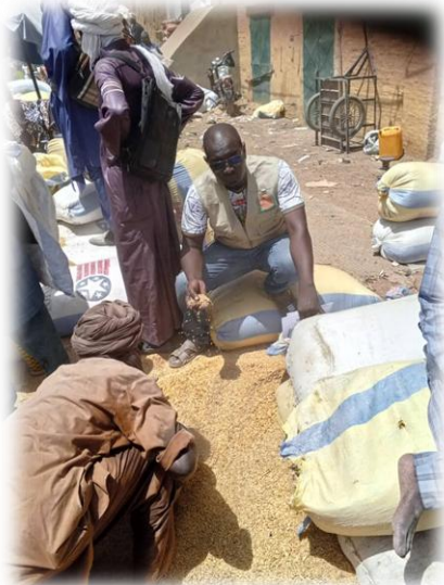
Suivi marché - Tonka - Juin 2025