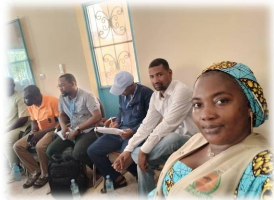
Rencontre d'échange avec la Cheffe de Bureau OCHA Mali, les Autorités régionale et les acteurs humanitaires - Bureau d'OCHA de Tombouctou - Juillet 2025