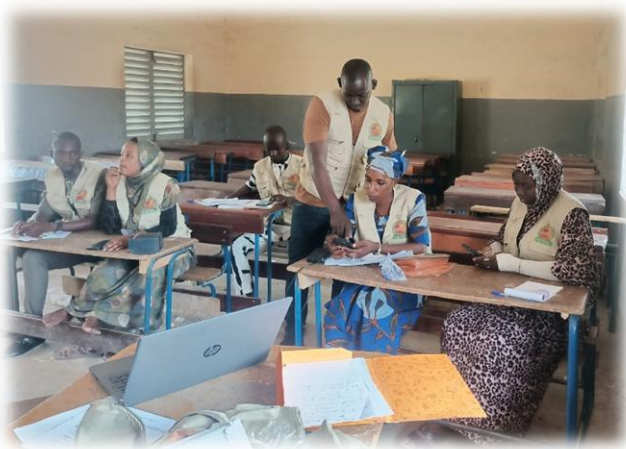
Formations des volontaires - Centre de Naifunké - Mai 2025