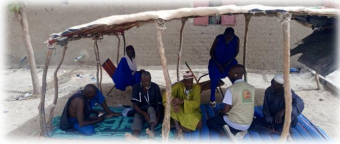
Discussions de groupe sur le suivi sécurité alimentaire et humanitaire - Léré - Juin 2025

Siège : Goundam ville, quartier Haribanda, Tombouctou - Mali Téléphone : (+223) 79403910 / (+223) 76285925 E-mail : vrdsahel@gmail.com , vrdsahel@yahoo.com