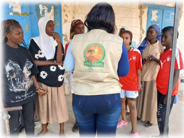
Séance de sensibilisation VGB - Tombouctou @ juin 2025