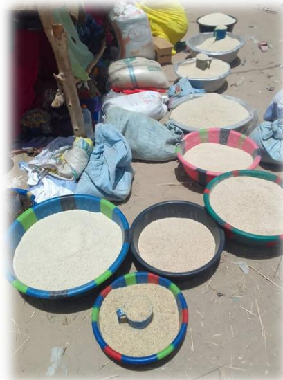
Suivi marché - Douekiré - Juin 2025