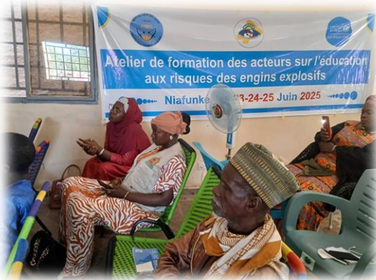
Formation des acteurs sur l'éducation aux risques des engins explosifs - Mairie de Soboundou - Juin 2025