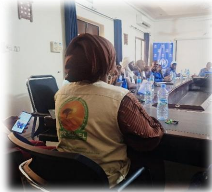
Cluster Protection - Bureau HCR de Tombouctou - Juin 2025