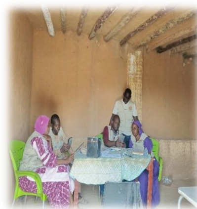
Formations des volontaires - Centre de Formations des volontaires - Centre de Tombouctou - Mai 2025 © VRD-Sahel Tonka - Mai 2025 © VRD-Sahel