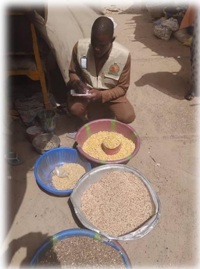
Suivi marché - Tombouctou - Juin 2025