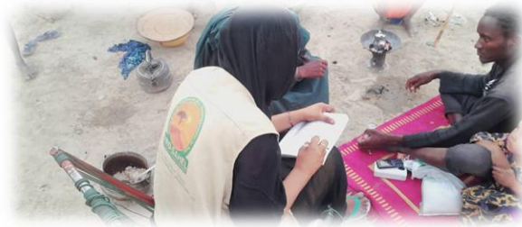
Séance de sensibilisation documentation d'état civil - Goundam @ Juin 2025